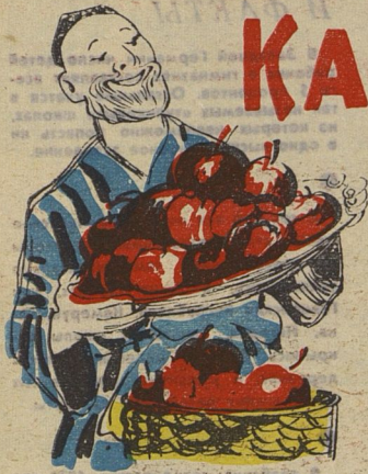
Рис. С. АНТОНОВА.